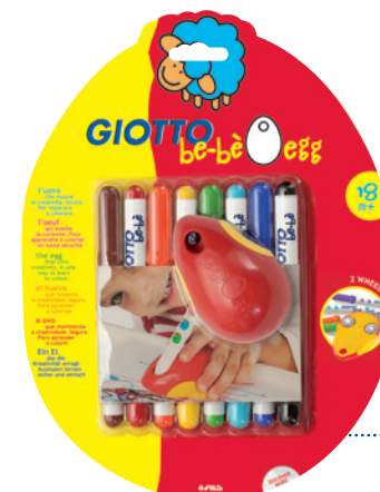
8er Set Faser- maler + Malmaus Code: 4641 00