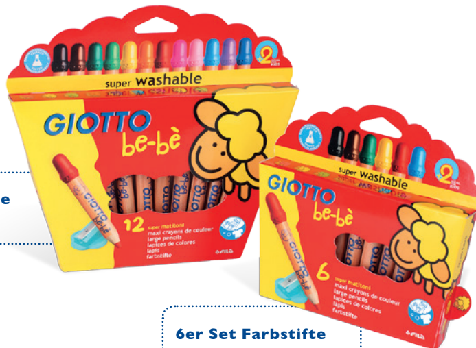
12er Set Farbstifte Code: 4665 00