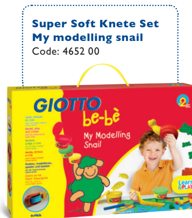
Super Soft Knete Set My modelling snail Code: 4652 00

Und wer nicht genug vom Kneten bekommt: Mit der be-bè Knet-Maschine und all ihrem Zubehör können sich kleine Knet-Künstler nach Lust und Laune kreativ ausdrücken.