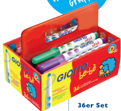
36er Set Fasermaler Schoolbox Code: 4612 00

Ideal im Kindergarten und für kleine Gruppen