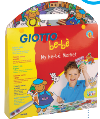
My be-bè market Code: 4657 00

12 Faserbilder, 30 ausmalbare Aufkleber zum Ausschneiden, eine Plastikscherre ohne scharfe Kanten und ein doppelseitiger Spielhintergrund (36 x 36cm) – Bauernhof (farm) oder Wochenmarkt (market). Einfach Schachtel auf und losgespielt!