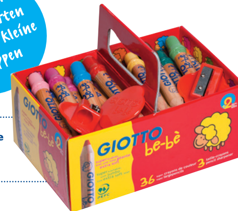
36er Set Farbstifte Schoolbox Code: 4613 00

Ideal im Kindergarten und für kleine Gruppen