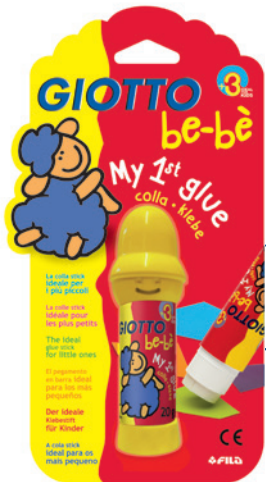
My first glue Klebestift Code: 4662 00

An seinem Rädchen lässt er sich unendlich lang drehen, ohne völlig herausgedreht werden zu können. Er ist frei von Lösungsmitteln und mit seinem breiten Durchmesser besonders griffig für Kinderhände. Also los: Kleben!