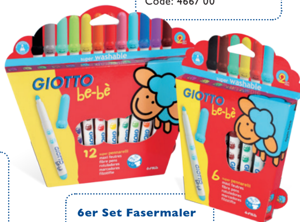
12er Set Fasermaler Code: 4667 00