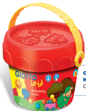
Großes Super Soft Knete Kit Code: 4676 00

Riesige Schmetterlinge flattern durch eine Wiese. Bunte Blumen entfalten Blatt für Blatt. Kleine, große und Monster-Fische erobern unbekannte Meere. Einfach die be-bè Super Soft Knete mit Hilfe der vielfältigen Werkzeuge ausrollen, schneiden, einritzen, ausstechen und modellieren. Ohne ablösbare Teile, extra für kleine Kinderhände konzipiert. Mit Giotto be-bè wird Knetmasse immer wieder zum Abenteuer.