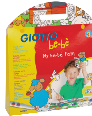
My be-bè farm Code: 4656 00

12 Faserbilder, 30 ausmalbare Aufkleber zum Ausschneiden, eine Plastikscherre ohne scharfe Kanten und ein doppelseitiger Spielhintergrund (36 x 36cm) – Bauernhof (farm) oder Wochenmarkt (market). Einfach Schachtel auf und losgespielt!