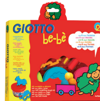
Super Soft Knete Geschenkset Code: 4629 00

Ein Fest für kleine Künstler: 6 Farbstifte, ein Spitzer, 8 Faserbilder und 3 x 100g Knete in den schönsten Farben plus einem Malbuch und 4 Modellierwerkzeugen.