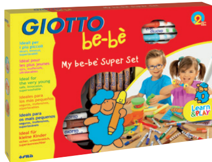
Super Set Code: 4669 00

Ein Fest für kleine Künstler: 6 Farbstifte, ein Spitzer, 8 Faserbilder und 3 x 100g Knete in den schönsten Farben plus einem Malbuch und 4 Modellierwerkzeugen.