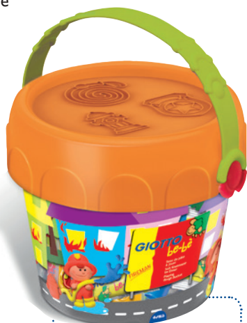
Spieleimer zum Thema Feuerwehr Code: 4682 00

Spuren ranken sich in der Knete? Stern-Schlangen und Knet-Herzen am Fließband? Die be-bè Super Soft Knet-Werkstätten haben geöffnet!