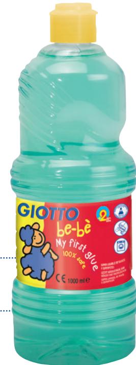
My first glue Flüssigkleber Code: 4663 00

Kinder und Flüssigkleber – das ist oft so eine Sache. Die durchsichtige Flüssigkeit ist am Ende überall! My first glue Flüssigkleber löst dieses Problem: Denn der Kleber ist im flüssigen Zustand leicht grünlich. Erst beim Trocknen wird er durchsichtig. So erkennen die Kinder ganz einfach, wo der Kleber schon ist. Natürlich ist er dermatologisch getestet und auswaschbar! So entstehen schönste Collagen und große Klebe-Projekte.