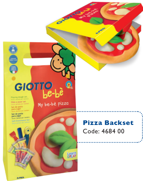
Pizza Backset Code: 4684 00

Kneten, ausrollen & formen - Früh übt sich, Pizza backen schon für die ganz Kleinen! Am Besten mit den Knetrollen, dem Nudelholz und dem Pizzamesser! Die Pizzabox für das Ergebnis darf natürlich nicht fehlen!