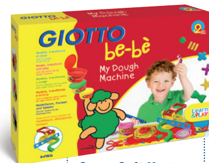
Super Soft Knete My dough machine Code: 4659 00