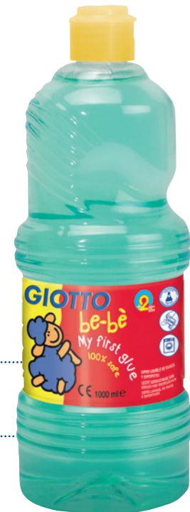
My first glue Flüssigkleber Code: 4663 00

Kinder und Flüssigkleber – das ist oft so eine Sache. Die durchsichtige Flüssigkeit ist am Ende überall! My first glue Flüssigkleber löst dieses Problem: Denn der Kleber ist im flüssigen Zustand leicht grünlich. Erst beim Trocknen wird er durchsichtig. So erkennen die Kinder ganz einfach, wo der Kleber schon ist. Natürlich ist er dermatologisch getestet und auswaschbar! So entstehen schönste Collagen und große Klebe-Projekte.