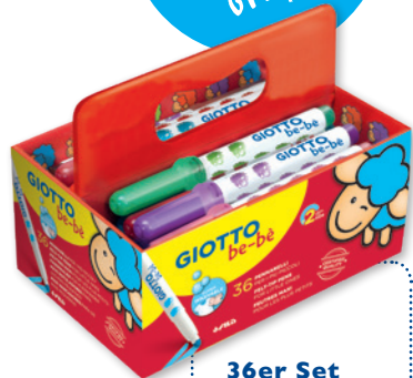
36er Set Fasermaler Schoolbox Code: 4612 00

Ideal im Kindergarten und für kleine Gruppen