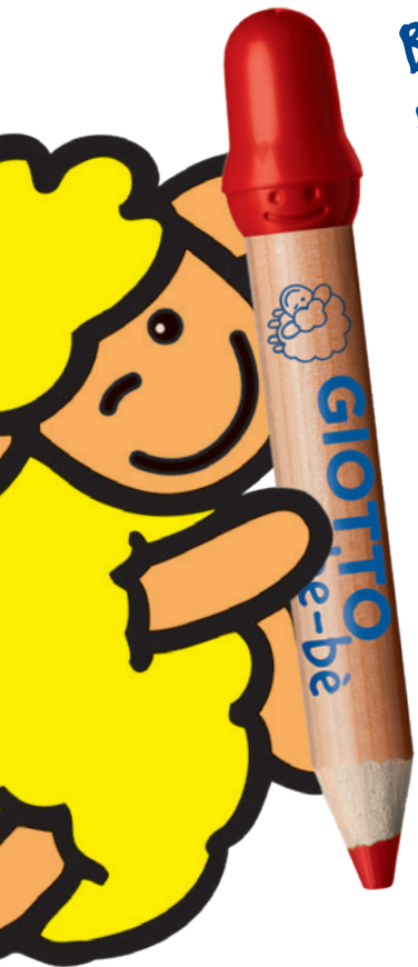
36er Set Farbstifte Schoolbox Code: 4613 00

Ideal im Kindergarten und für kleine Gruppen