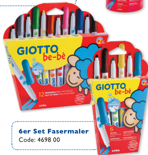
6er Set Fasermaler Code: 4698 00

Wenn Kreativität und Schwung zusammen kommen, dann ist die Malmaus mit im Spiel.