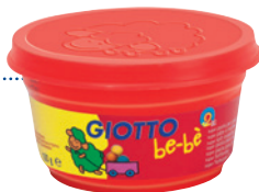
3er Set Super Soft Knete (je 100 g)