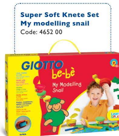
Super Soft Knete Set My modelling snail Code: 4652 00

Und wer nicht genug vom Kneten bekommt: Mit der be-bè Knet-Maschine und all ihrem Zubehör können sich kleine Knet-Künstler nach Lust und Laune kreativ ausdrücken.