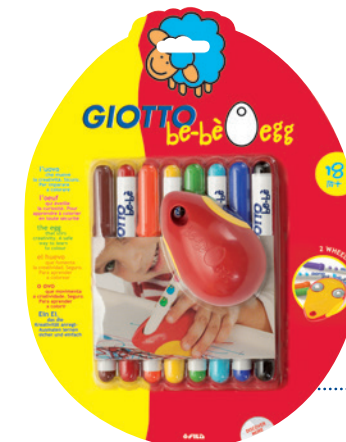
8er Set Faser- maler + Malmaus Code: 4641 00