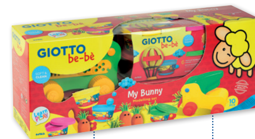
Knetmaschine My Bunny Code: 4793 00