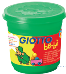
Super Soft Knete 220 g