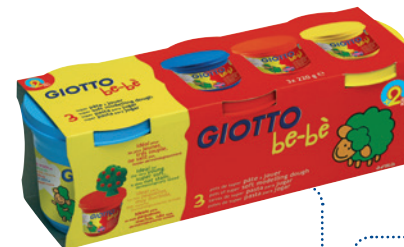
3er Set Super Soft Knete (je 220 g)