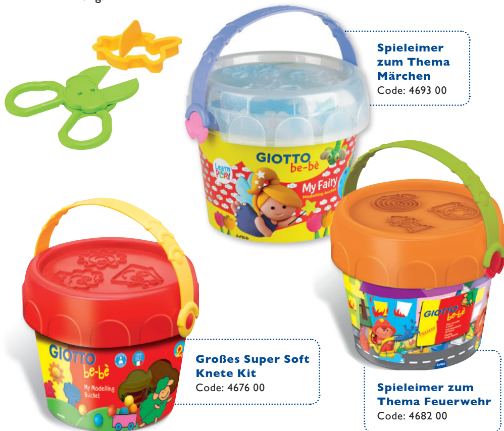
Spieleimer zum Thema Märchen Code: 4693 00

Riesige Schmetterlinge flattern durch eine Wiese. Bunte Blumen entfalten Blatt für Blatt. Kleine, große und Monster-Fische erobern unbekannte Meere. Die praktischen Spieleimer bieten mit be-bè Super Soft Knete und Zubehör alles, was für ein Knetabenteuer benötigt wird. Egal ob zuhause, bei den Großeltern oder unterwegs, in dem Spieleimer lässt sich alles leicht verstauen und transportieren. Heute Märchen, morgen Feuerwehr – spannende Themenwelten bieten Abwechslung.